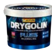
Drygolin Plus Oljemaling