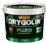
Drygolin Plus Oljedekkbeis